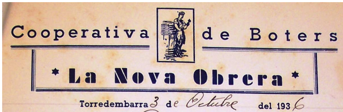
Capçalera de les cartes oficials de la Cooperativa, 3-X-1936, AMTO.